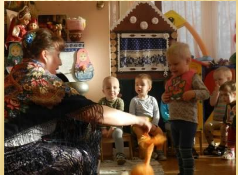
Интерактивный показ сказки «Колобок»