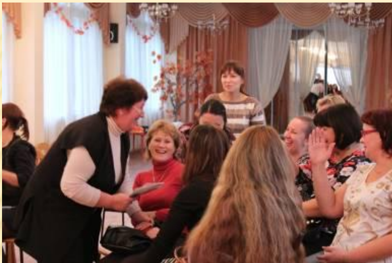
Обсуждение творческих конкурсов