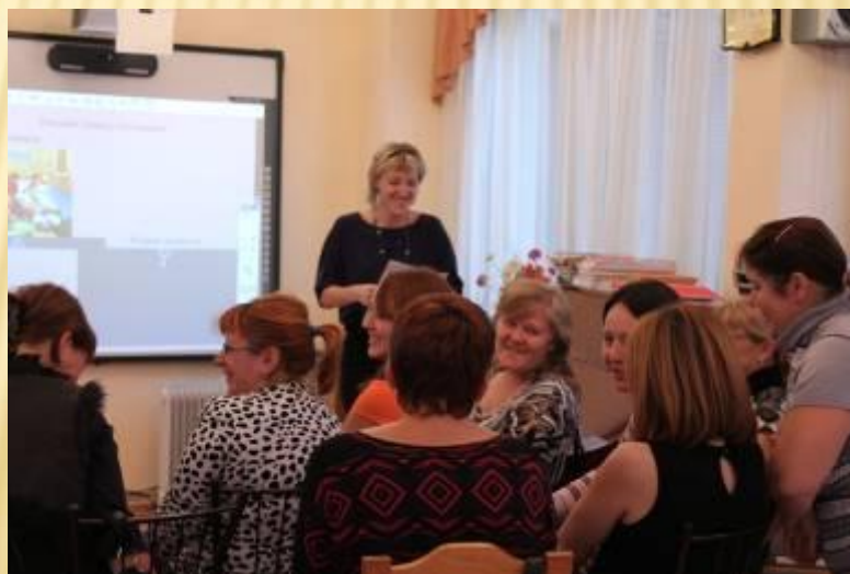
Подведение итогов деловой игры