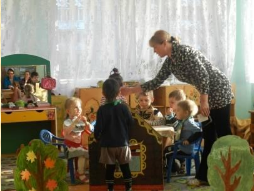
Интерактивный показ сказки «Теремок»