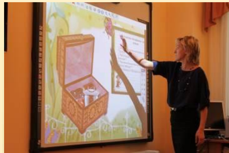
Презентация проекта по развитию речи