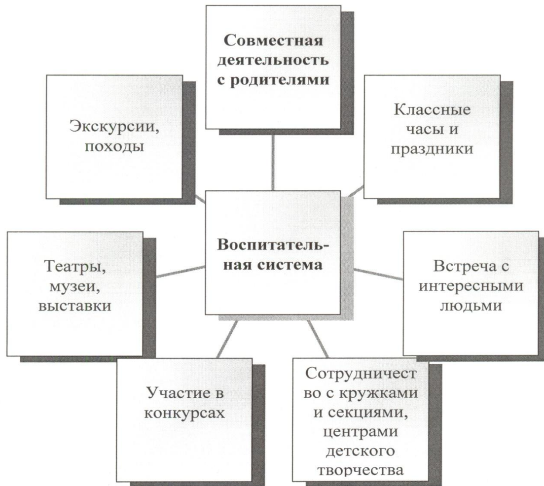
Схема реализации воспитательной системы через деятельность.

Главные направления учебно-воспитательной работы - нравственное и экологическое воспитание.