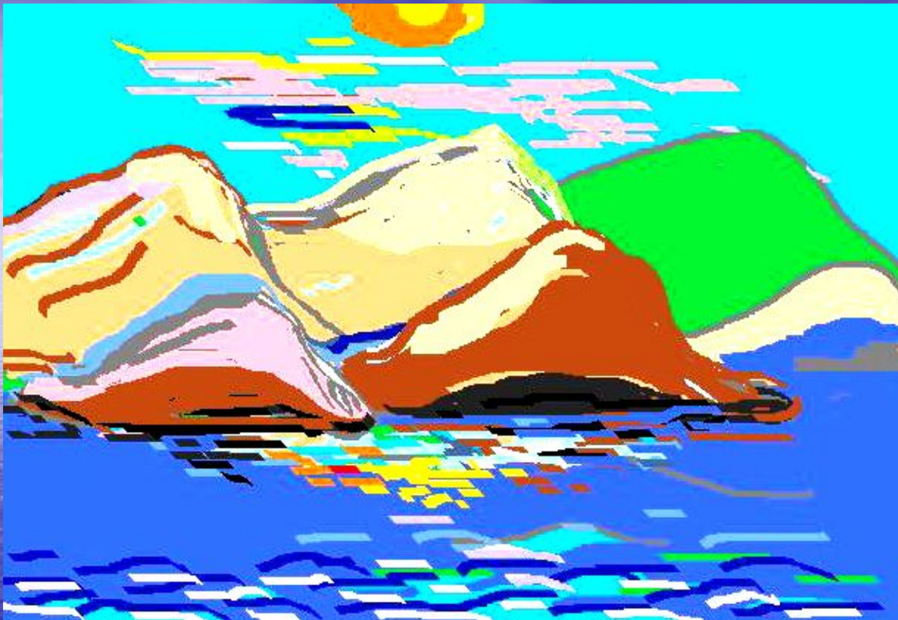
« Частичка великого Байкала», (автор пейзажа – Глушкова Л.П.)