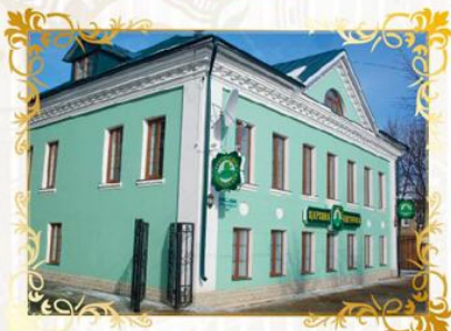
Гостевой дом «Царевна-Лягушка»

Many know Russian national fairy tale on a tsarevna, which Koshchej has transformed into a frog. But not many guess that a tsarevna-frog has spent three long years in the Rostov bogs on lake Nero. In our museum you learn, how her life during this time proceeded.