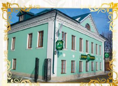
Гостевой дом «Царевна-Лягушка»

Many know Russian national fairy tale on a tsarevna, which Koshchej has transformed into a frog. But not many guess that a tsarevna-frog has spent three long years in the Rostov bogs on lake Nero. In our museum you learn, how her life during this time proceeded.