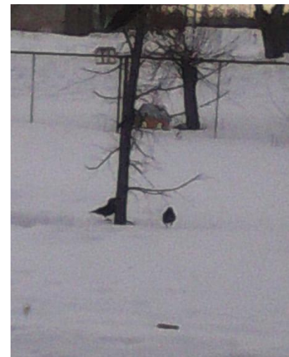
«Птицы на нашей кормушке»