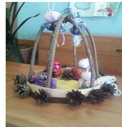
«Птичья столовая» - коллективная работа -