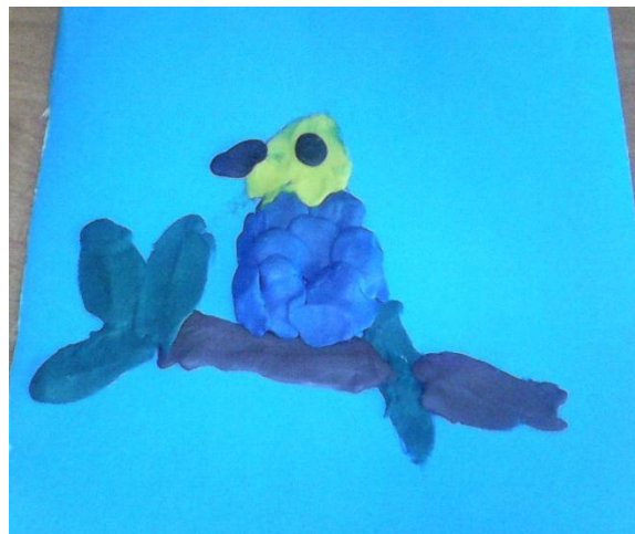
«Птичка - невеличка» - Коунина Нина