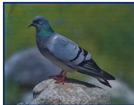
«Голубь на камне» Калинин Егор