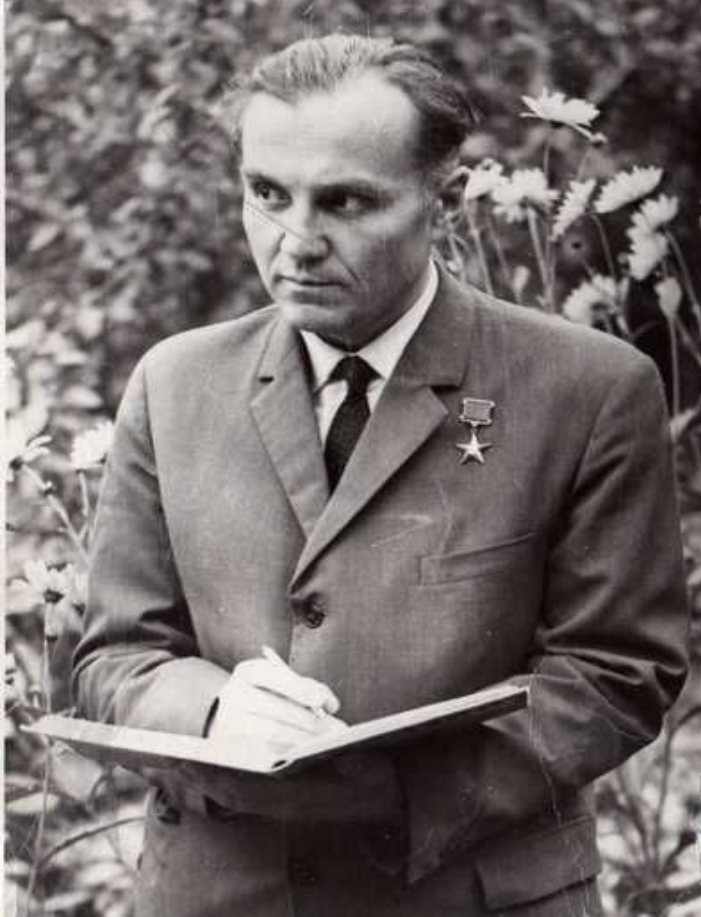
Василий Александрович Сухомлинский