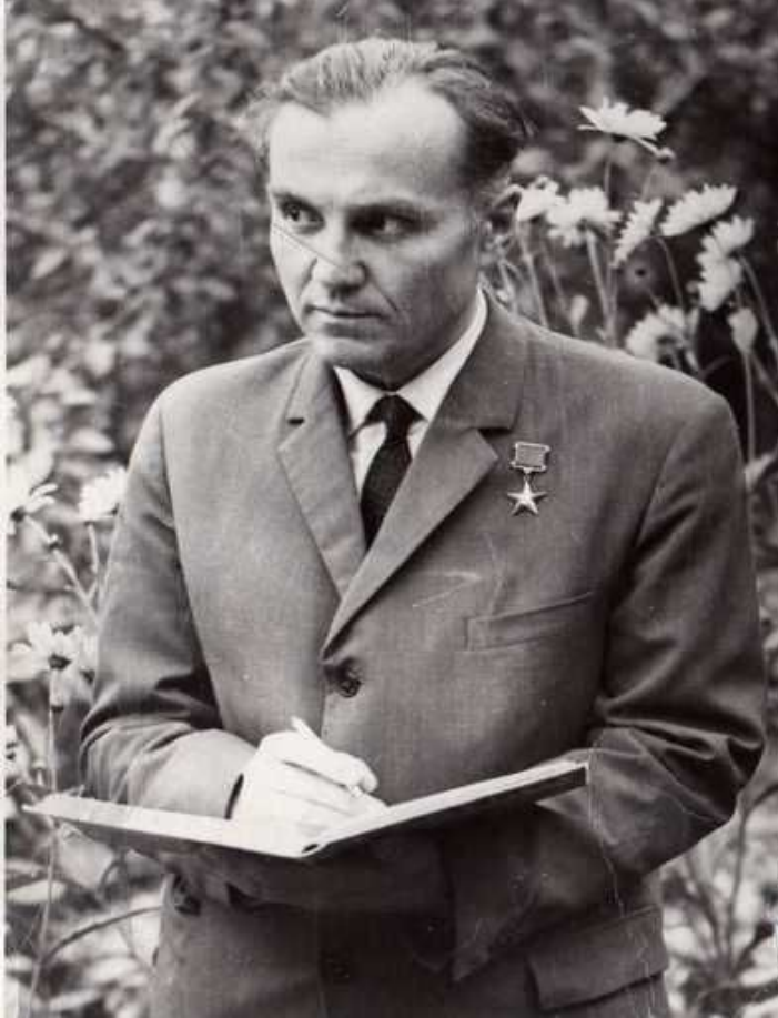
Василий Александрович Сухомлинский (1918 – 1970 гг.) украинский советский педагог

«Каждый человек уже в годы детства и особенно в отрочестве и ранней юности должен постичь счастье полноты своей духовной жизни, радость труда и творчества» .