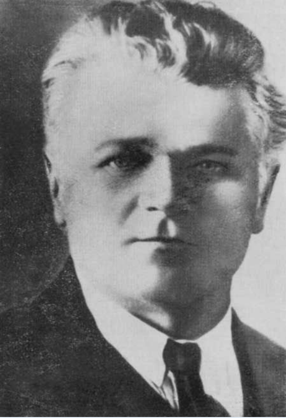
Станислав Тимофеевич Шацкий (1878 – 1934 гг.) советский педагог

На практике воплотил свою идею самоуправления школьников.