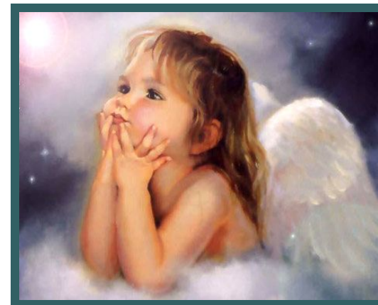
Л. Петрушевская «Как ангел»

Ангелина, Непонятая и чистая, Отталкивает, пугает, притягивает. Лёгкий пух, подхваченный ветром. Злодейка-судьба.