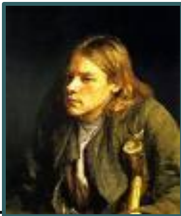
И. Бунин «Роман горбуна»

Горбун, Одинокий, ранимый, Страдает, мечтает, ждёт. Беспощаден кто-то к человеку. Жизнь.