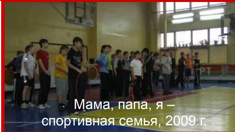
Мама, папа, я – спортивная семья, 2009 г.