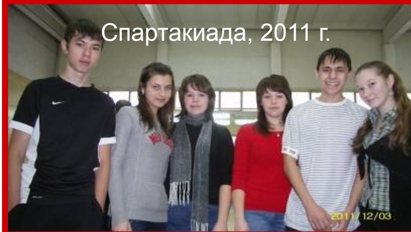
Спартакиада, 2011 г.