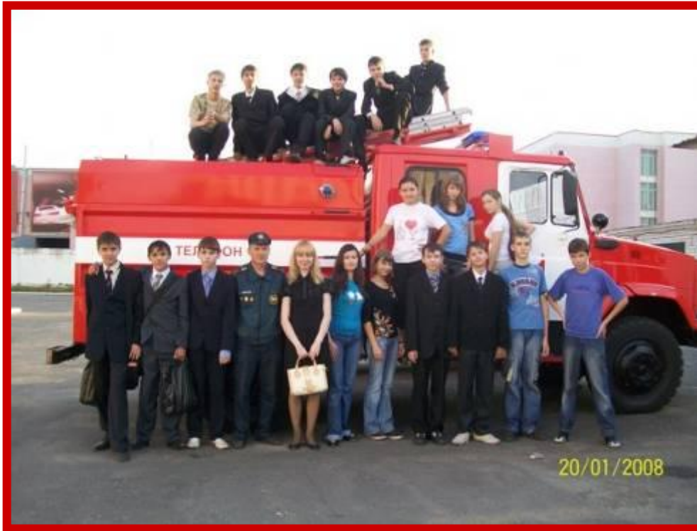
Спортивные занятия в пожарной части, 2008 г