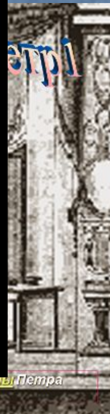
портреты Петра первого)