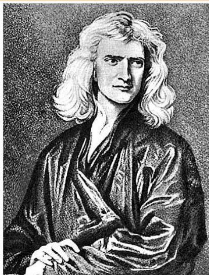
Исаак Ньютон (1642 - 1727) – физика