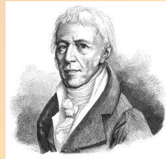
Жан Батист Ламарк (1744 - 1829) – биология

НАСЛЕДИЕ XVII – XVIII ВЕКОВ, ВРЕМЕНИ ЗАРОЖДЕНИЯ, ОБОСОБЛЕНИЯ И БУРНОГО РАЗВИТИЯ НАУЧНЫХ ПРЕДМЕТОВ