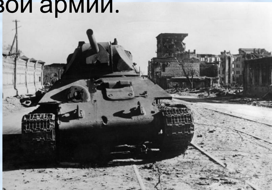
Oktober 1942