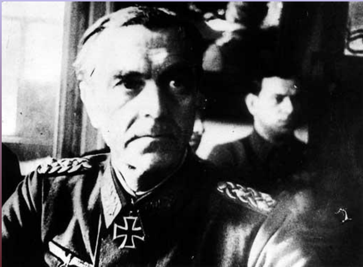
Командующий 6-й немецкой армией фельдмаршал Фридрих фон Паулюс