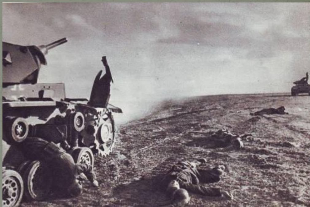
Атака немецких танков отбита

28 июля 1942 года Народный комиссар обороны СССР издал приказ № 227, вошедший в историю под названием «Ни шагу назад!»