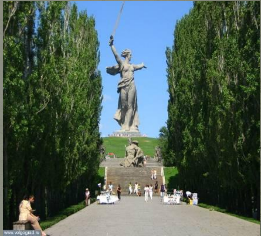
Мемориальный комплекс на Мамаевом кургане (современный вид)

Бои за курган начались 14 сентября 1942 года.