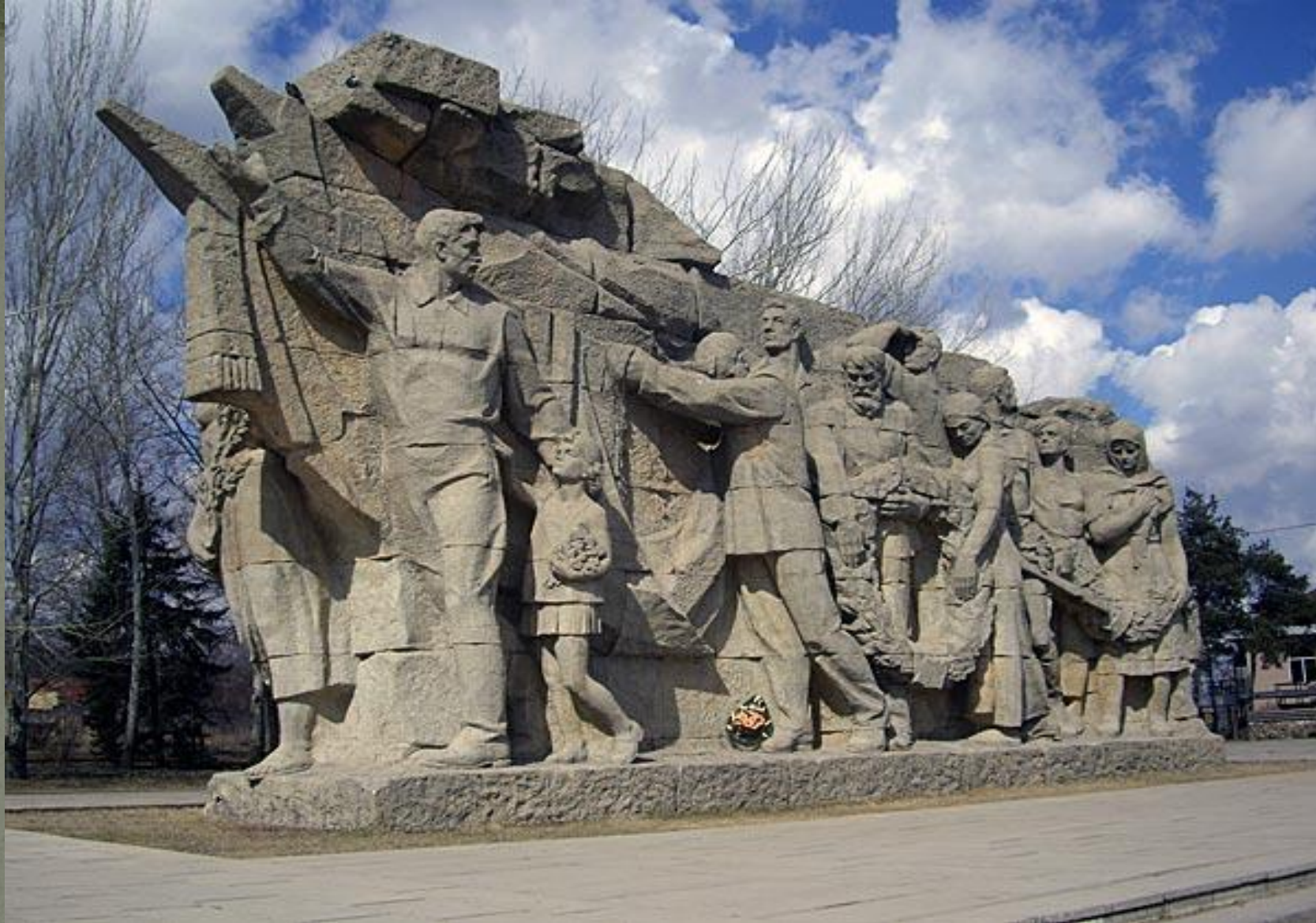
У входа на Мамаев курган. Скульптура «Память поколений».