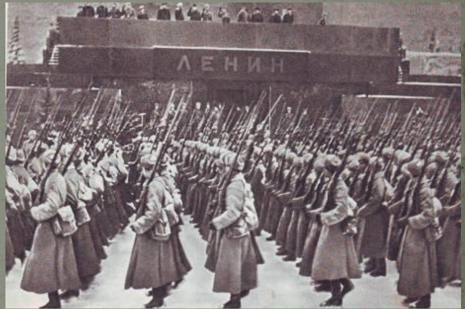
Парад советских войск на Красной площади

6 декабря 1941 года войска Западного Калининского и Юго-Западного фронтов перешли в контрнаступление под Москвой. В январе 1942 года Красная Армия развернула общее наступление на широком фронте и продвинулась на запад местами более чем на 400 километров.