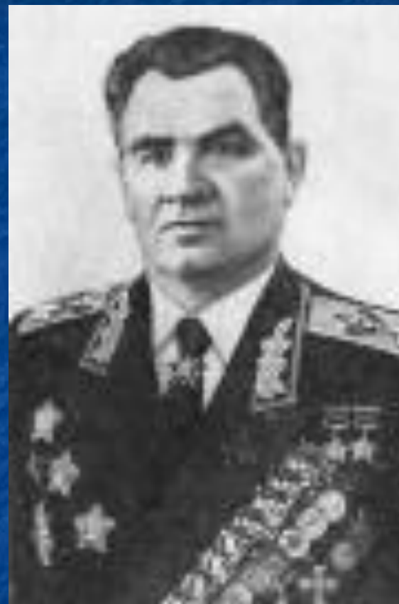
В. И. Чуйков

«...Казалось, что всё живое должно было погибнуть среди этого моря огня, среди непрекращающихся бомбёжек, что человеческие нервы больше не способны выдержать этого адского напряжения. Но войны выдержали. Несокрушимой стеной стояли они на своих рубежах...»