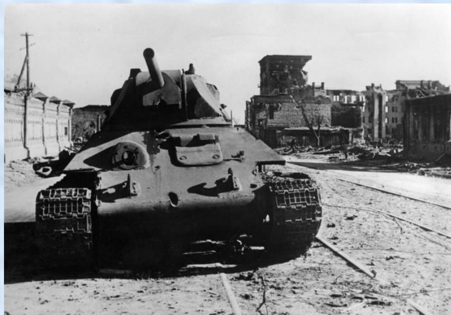
Oktober 1942