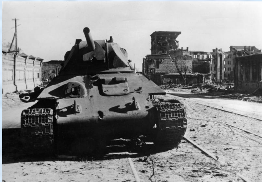
Oktober 1942