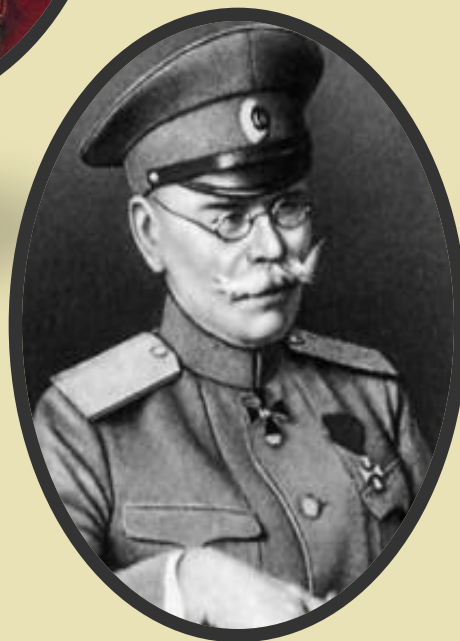
Великий князь Николай Николаевич Верховный Главнокомандующий всеми сухопутными и морскими силами Российской Империи в начале Первой мировой войны (1914—1915)