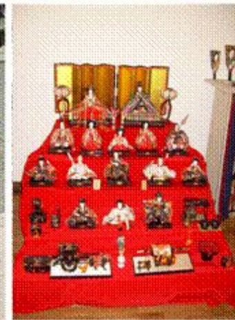
3марта - День девочек