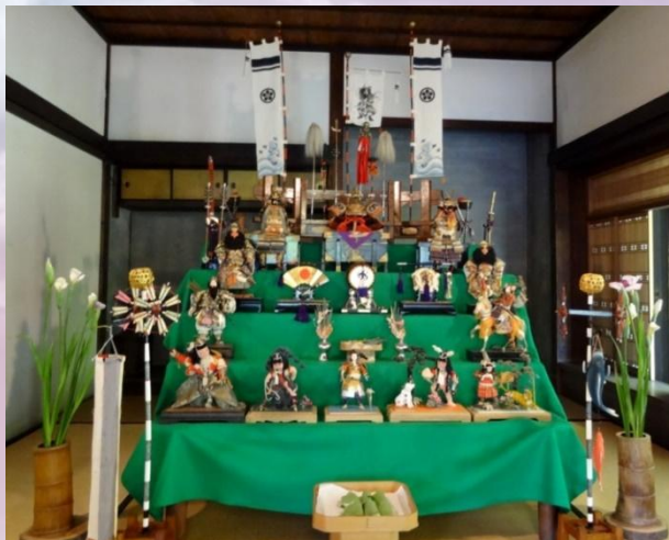
5мая - День мальчиков