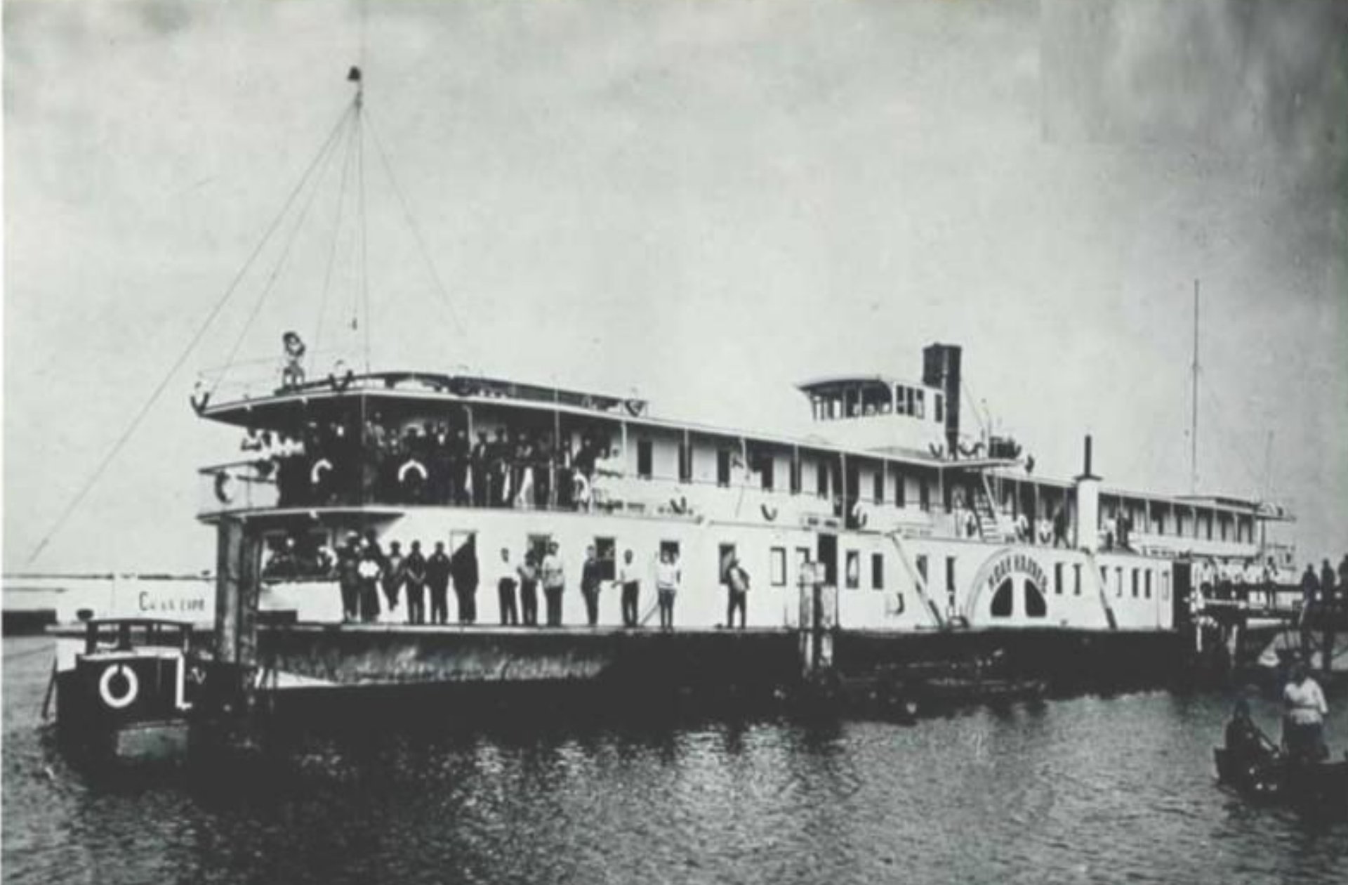
Пар. "И. Калыев" на котором жили карьерные строители.