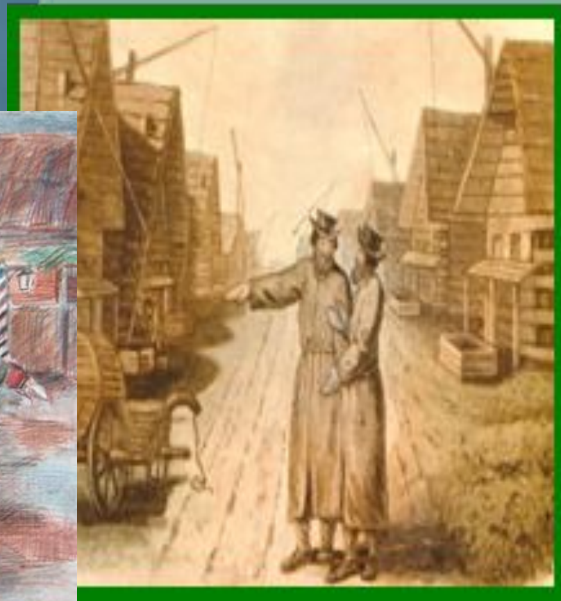
А.Н.Москалев. ЯМ Тосно. Прибытие Петра I в Тосно