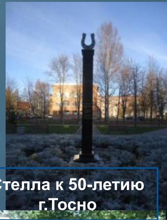
Стелла к 50-летию г.Тосно