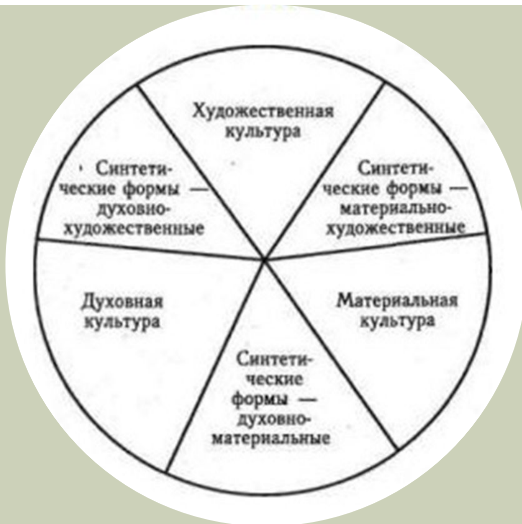
СХЕМА СТРОЕНИЯ КУЛЬТУРЫ