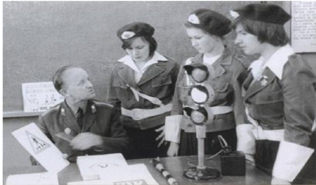
Изучение правил дорожного движения членами школьного отряда юных инспекторов движения в г. Череповец Вологодской области (1973 г.)

Уже 43 года помощниками ГИБДД является отряд Юных инспекторов движения,