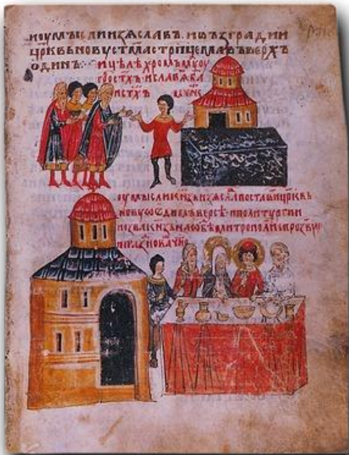
Исцеление хромого у гроба святых Бориса и Глеба (вверху). Трапеза у кн. Изяслава по случаю сооружения новой церкви во имя св. князей-страстотерпцев.