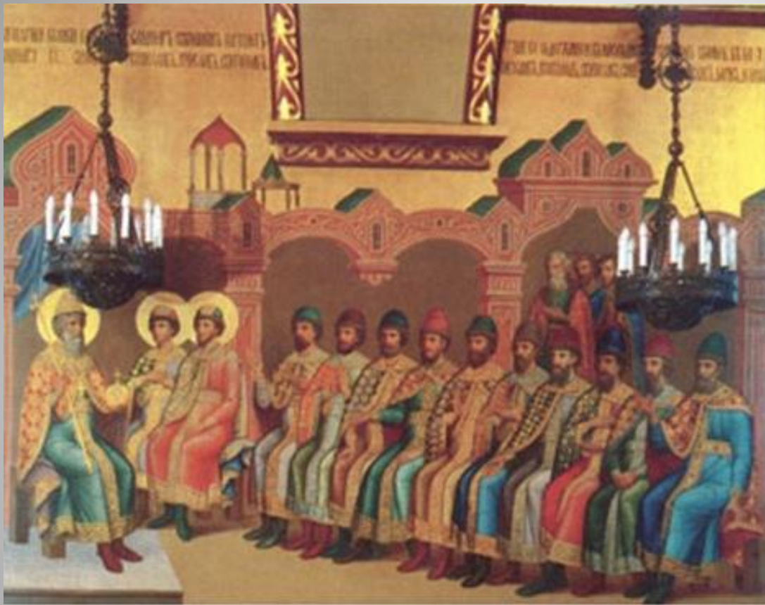
Роспись восточной стены Грановитой палаты «Великий князь Владимир Святославович с сыновьями»