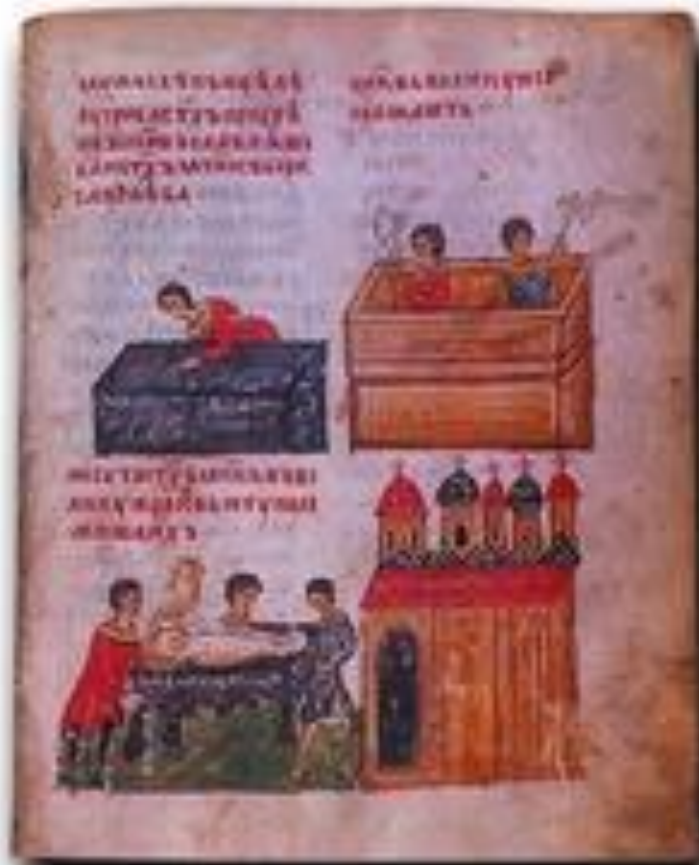
Исцеление слепого у гробницы св. князей. Строительство собора во имя святых Бориса и Глеба (вверху). Мощи св. князей переносят в храм.