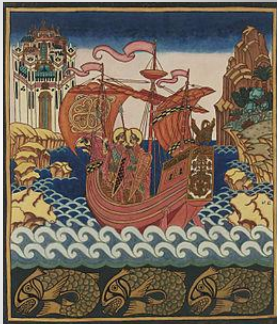
художник Иван Билибин «Святые Борис и Глеб на корабле»