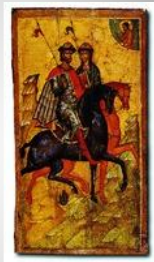
Святые Борис и Глеб. Икона из Успенского собора Московского Кремля. 1340 г