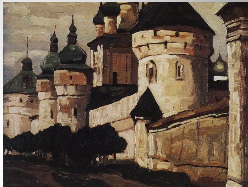
«Ростов Великий» художник Н.Константинов