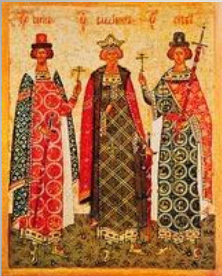
Святые Борис и Глеб и равноапостольный князь Владимир. Икона из Софийского собора в Новгороде кон. XV — нач. XVI в.