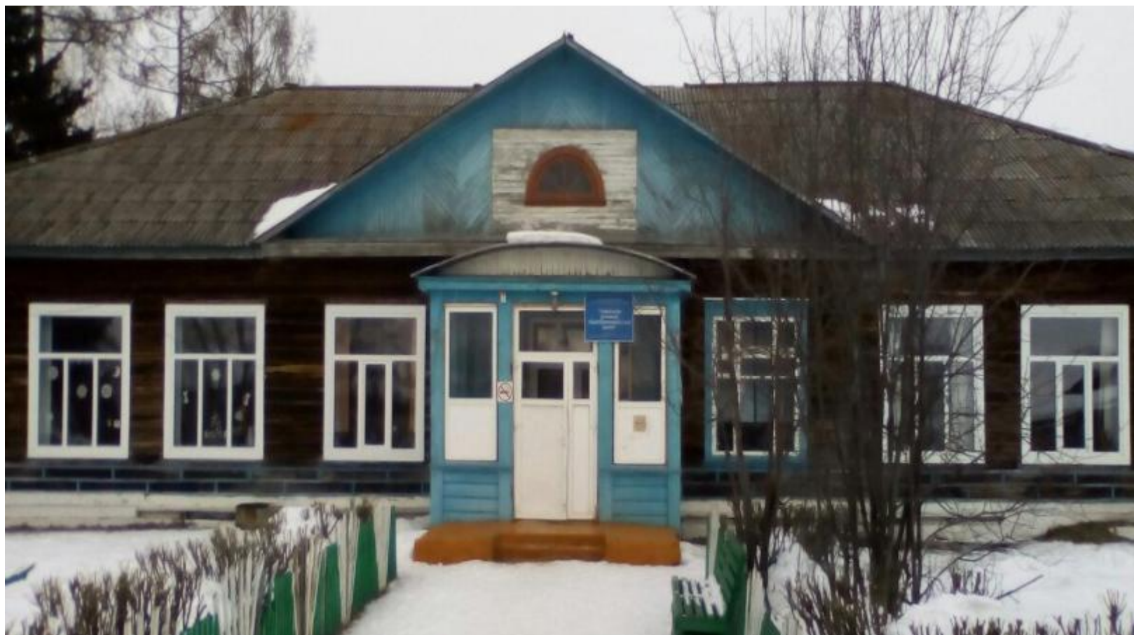
МБОУ «Тайнинская ООШ»