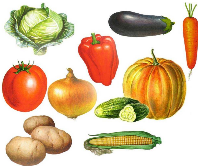
Игра «Назови одним словом»