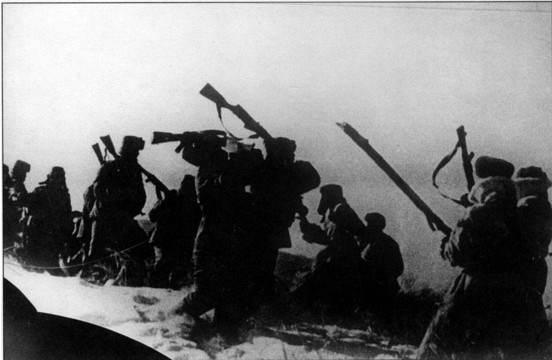
«Атака» китайцев на советских пограничников. Одна из драк на о. Даманском. Зима 1969 г.