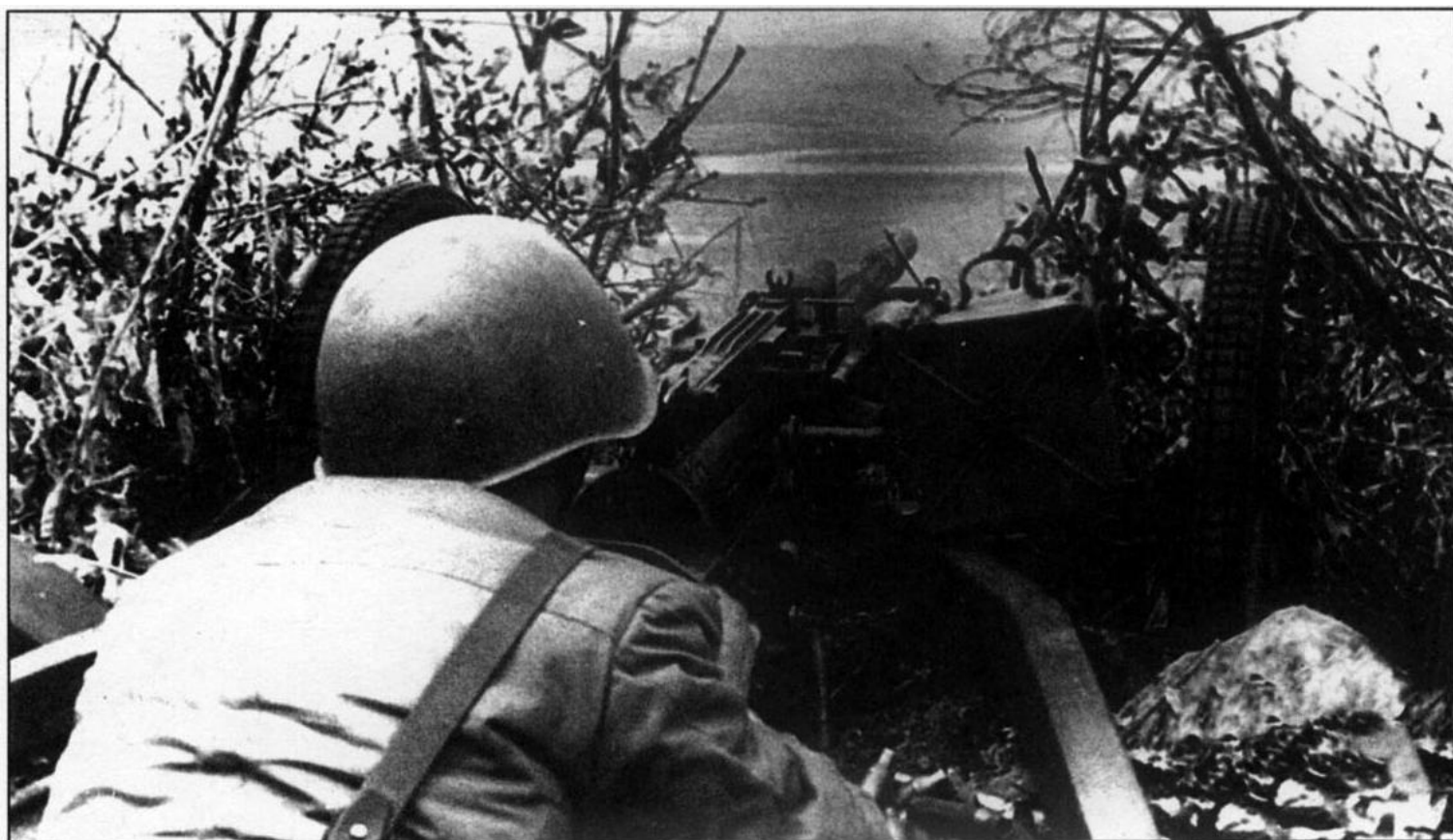
Майор Жезлов во время боя 15 марта 1969 г. на о. Даманский