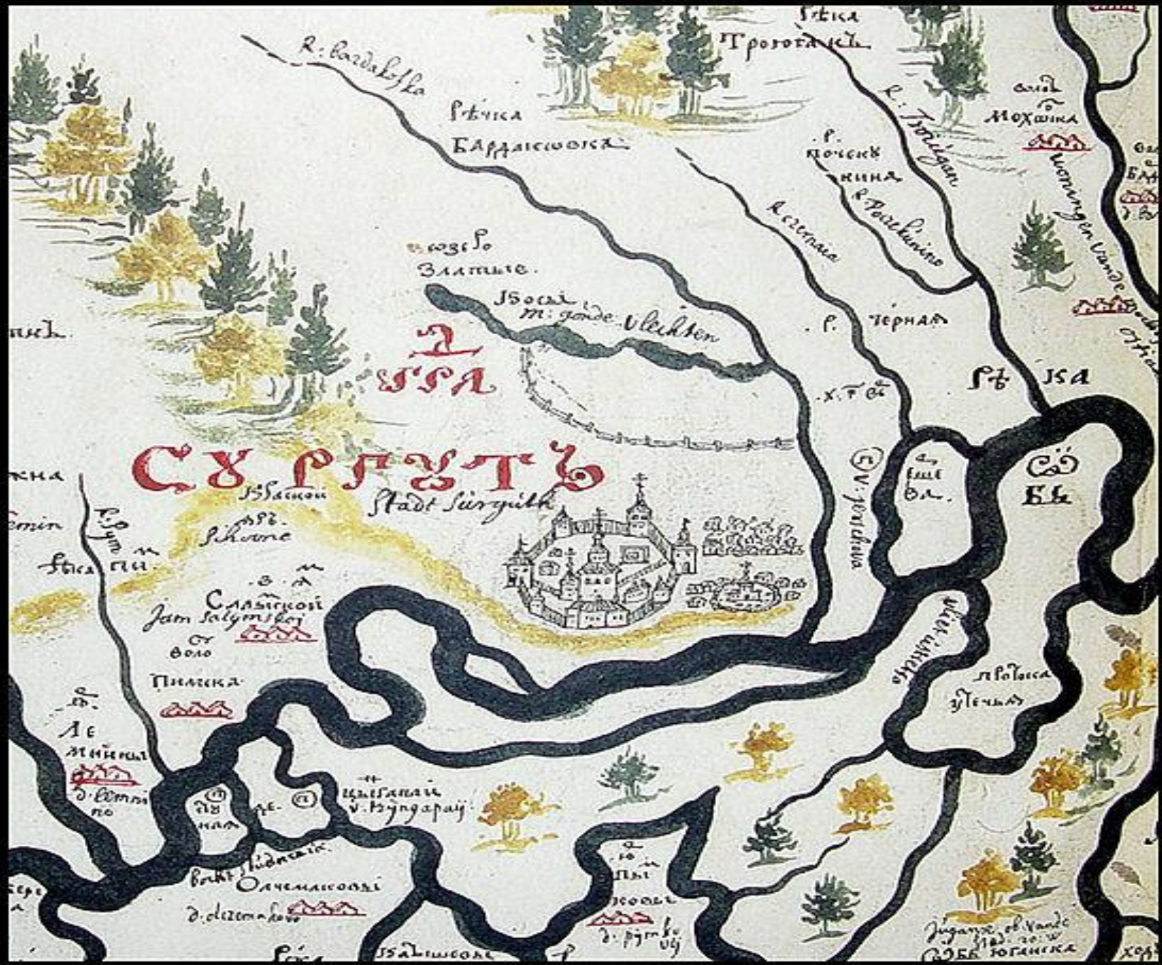
КАРТА СУЗДА 1701 ГОДА