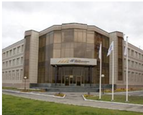
РИИЦ «Нефть приобья»