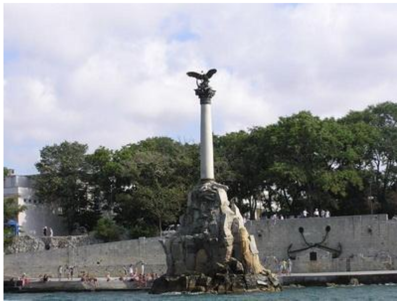
Памятник затопленным кораблям