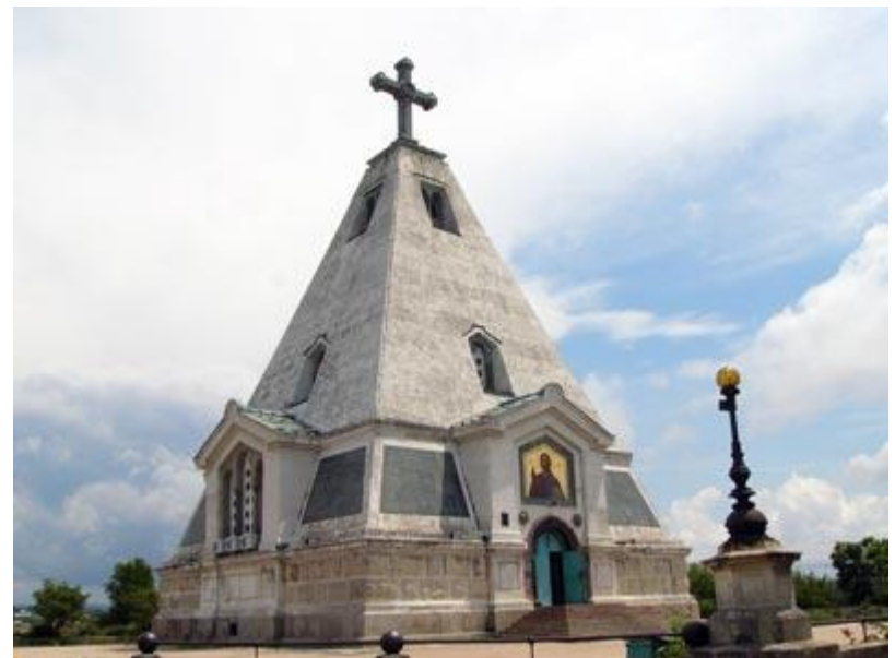
Храм святого Николая