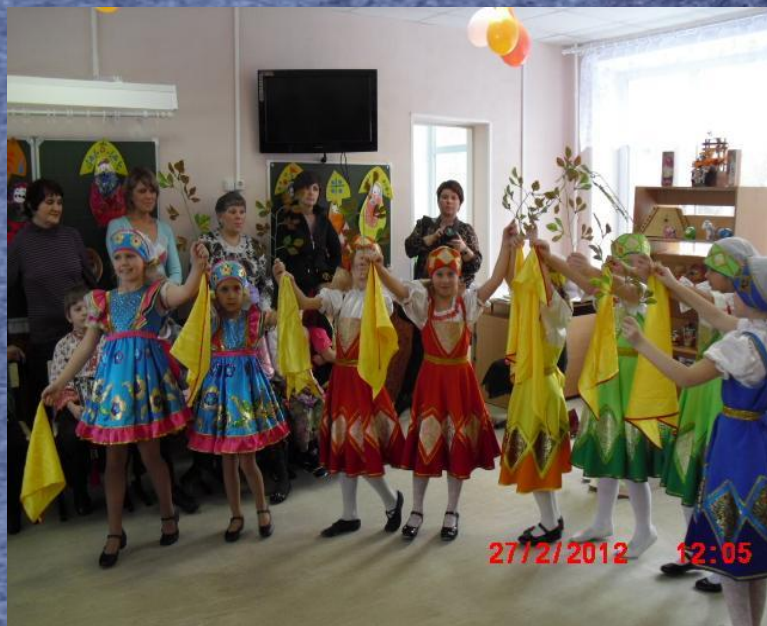
Русский народный танец «Берёзка»