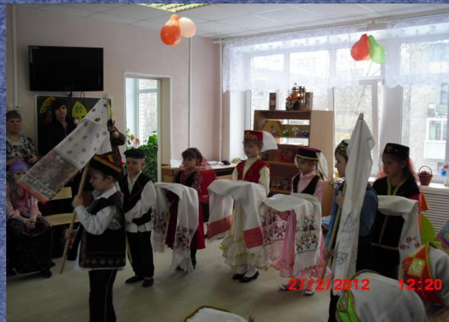
Татарский народный танец «Сабантуй»