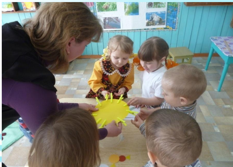
РАЗВИТИЕ МЕЛКОЙ МОТОРИКИ