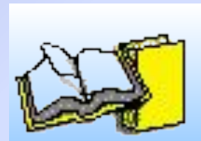
СХЕМА ПЛАНА ТЕМАТИЧЕСКОГО КОНТРОЛЯ