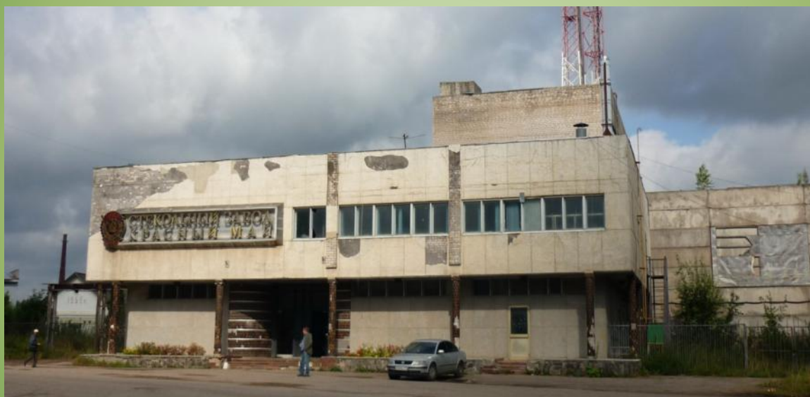
Завод «Красный май»