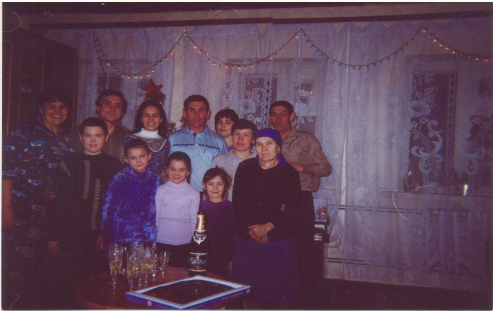
Әлфия апа балалар һәм оныклар белән