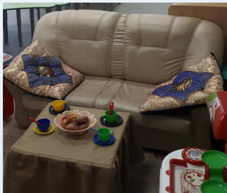
Центр отдыха и уединения