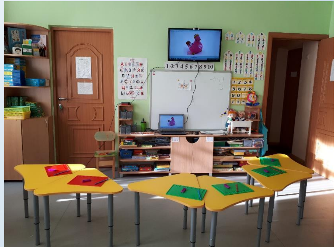
Центр правильной речи и математического развития