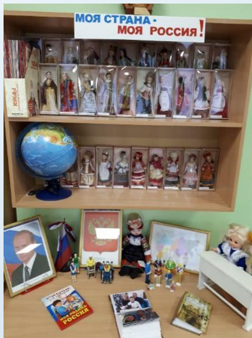
Центр патриотического развития и мировой культуры, модуль гендерного воспитания