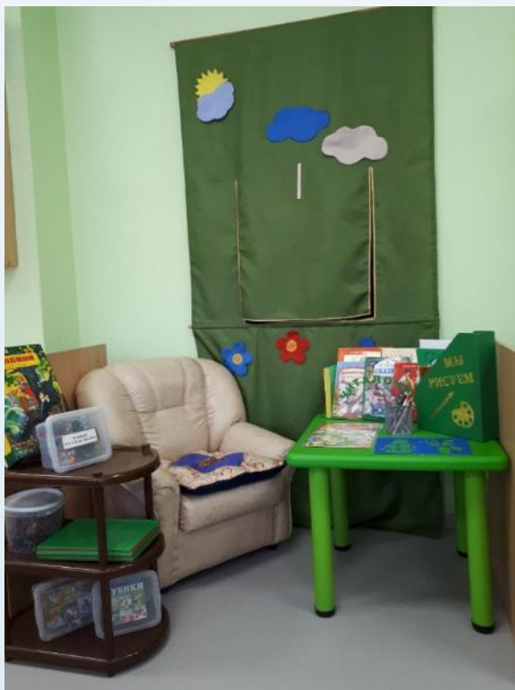
Центр продуктивной деятельности

Спокойная зона должна быть превращена в функциональное пространство для спокойной деятельности детей (чтение книг и рассматривание картинок, рассматривание семейных альбомов, разукрашивание и т.п.)