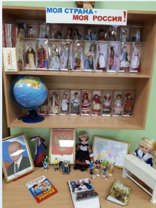
Центр патриотического развития и мировой культуры, модуль гендерного воспитания