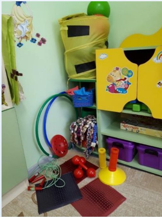
Центр двигательной активности

Активная зона должна быть превращена в функциональное пространство для деятельности связанной с интенсивным движением, возведением крупных игровых построек и т.п., для реализации 5-ти образовательных областей в разных видах детской деятельности – модуль «кухня», «семья», «автопарковка», «фитнес клуб» и др.