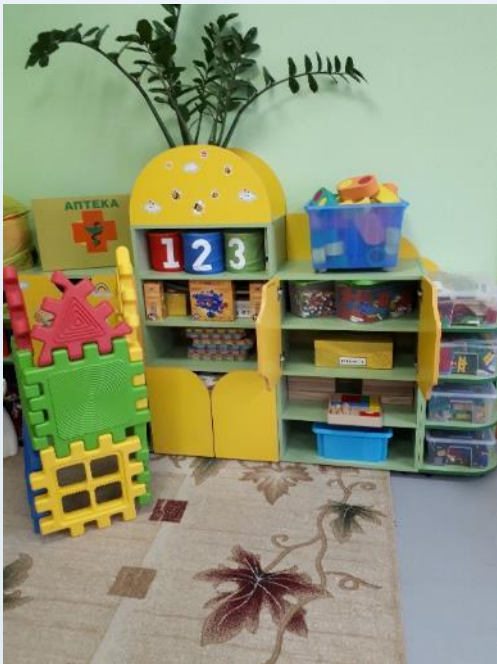
Центр сенсорика - конструирование