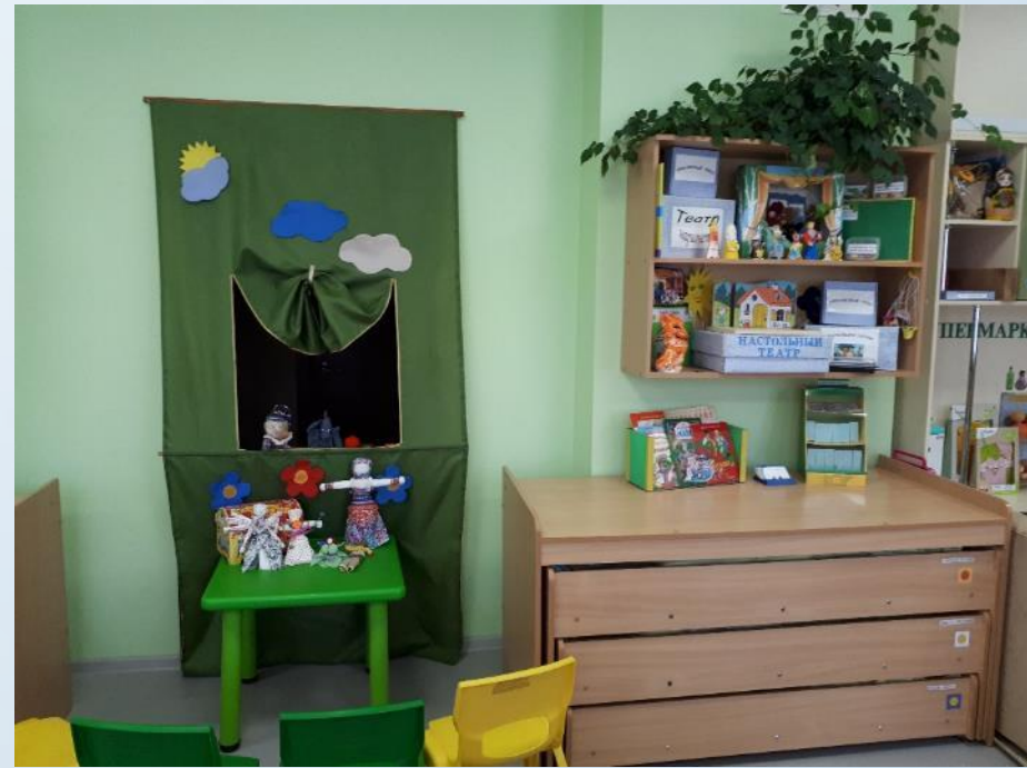
Центр музыкально – театрализованной деятельности