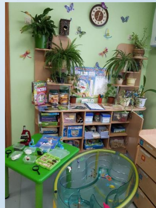
Центр познавательно – исследовательской деятельности, живой и неживой природы.