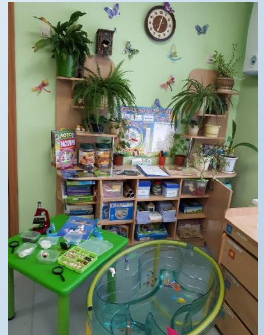
Центр познавательно – исследовательской деятельности, живой и неживой природы.