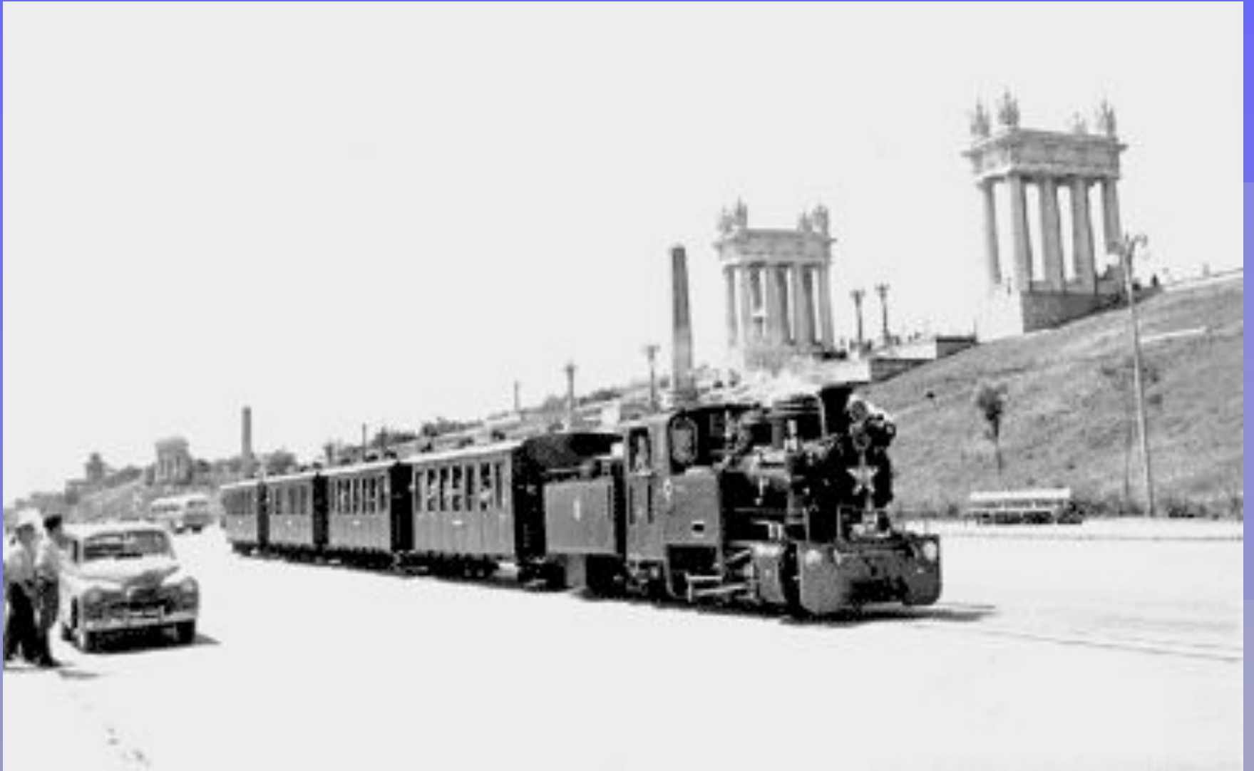
Набережная Сталинграда с Детской Железной Дорогой