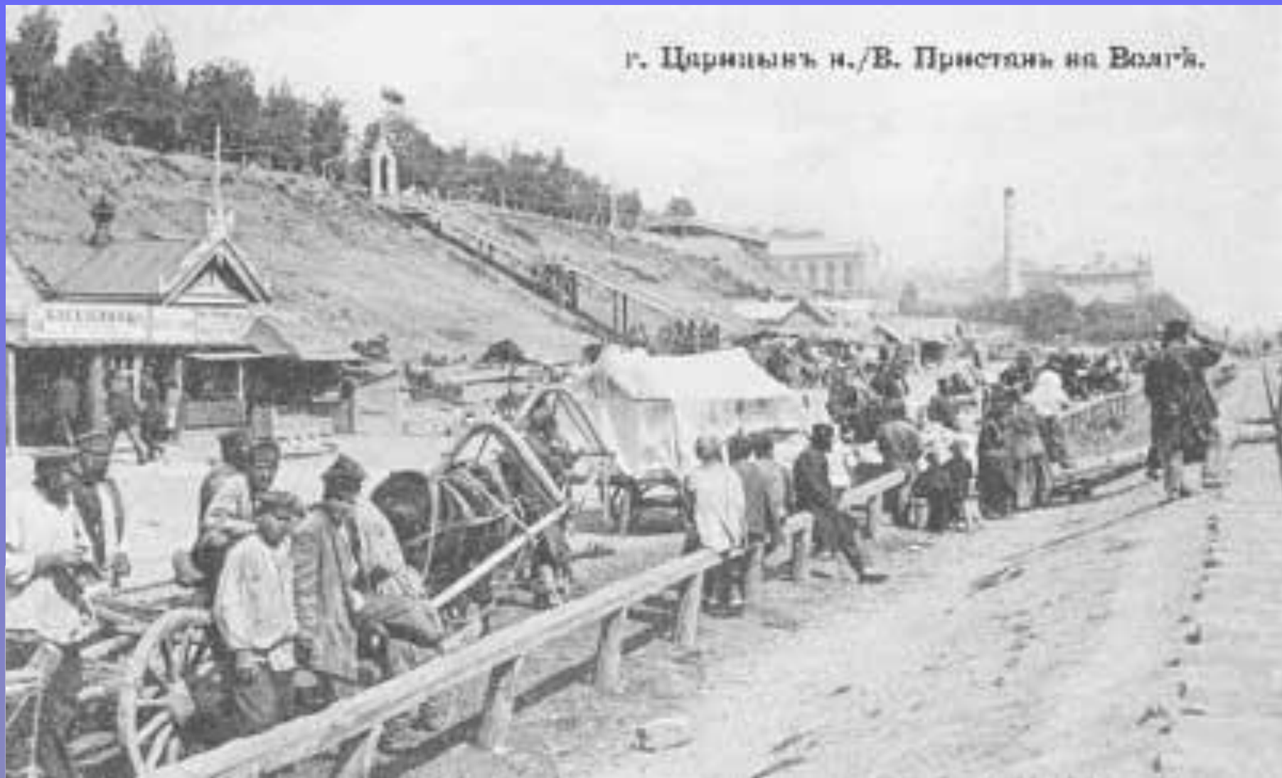
г. Царицынъ н./В. Пристань на Волгѣ.