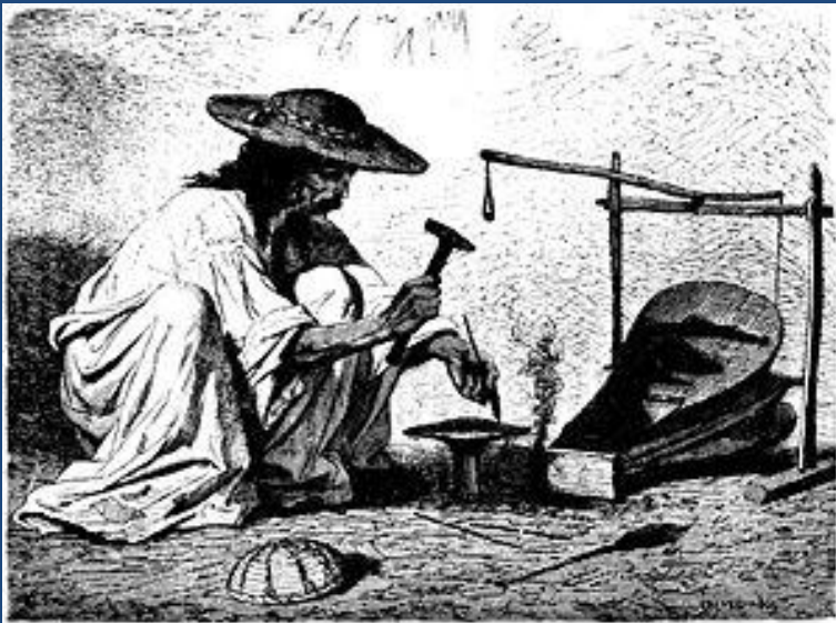
Цыган-кузнец. Гравюра Теодора Валерио

Исторически в число женских занятий входило выпрашивание милостыни.