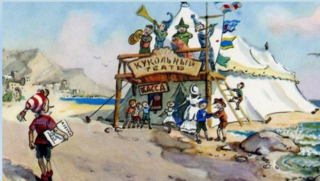
А. Толстой «Золотой ключик, или Приключения Буратино»

Папа Карло купил «Азбуку» с крупными буквами и цветными картинками и отправил сына в школу. А Буратино куда пошел?