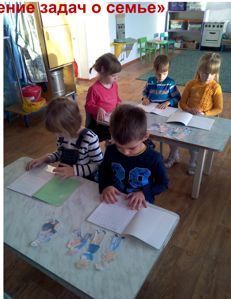
Работа в тетрадях