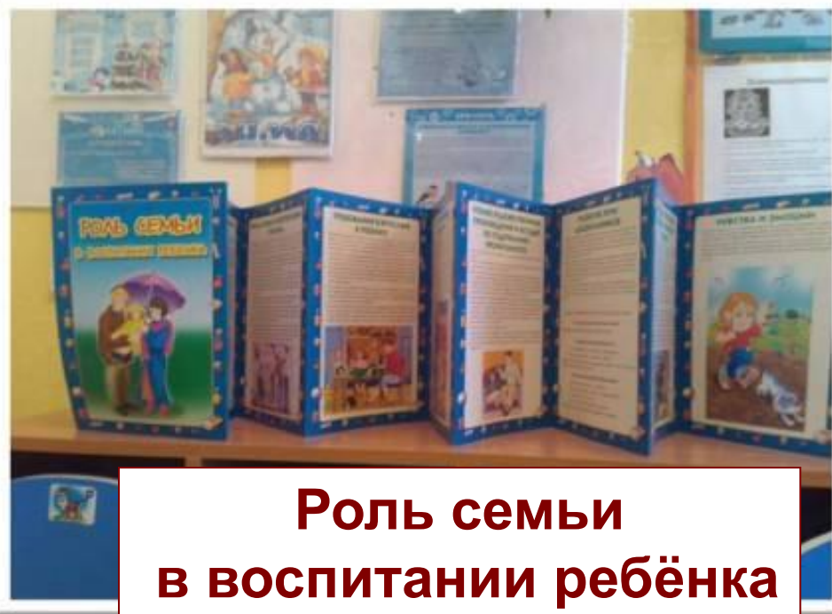
Роль семьи в воспитании ребёнка