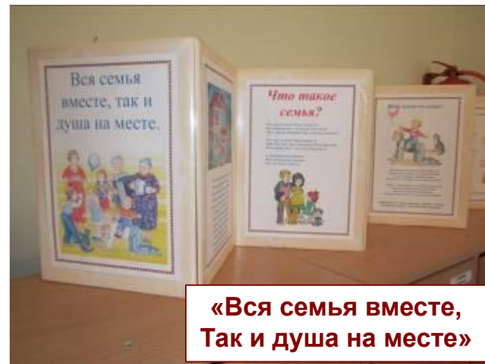
«Вся семья вместе, Так и душа на месте»