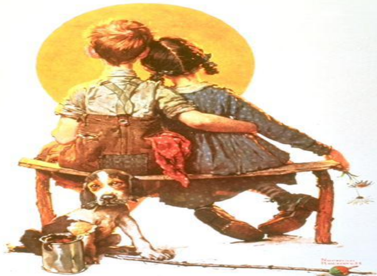
Illustration by [unreadable]