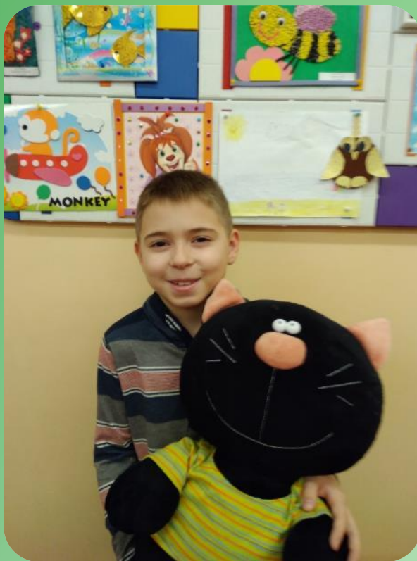
Волонтерская акция в рамках районного-фестиваля-конкурса «Созвездие Малой медведицы»