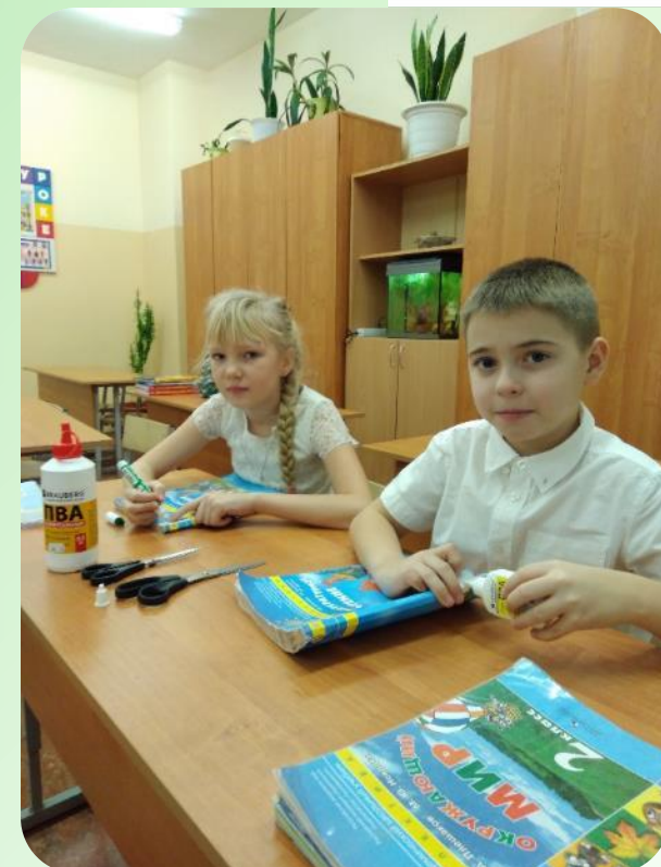
Ремонт книг для школьной библиотеки