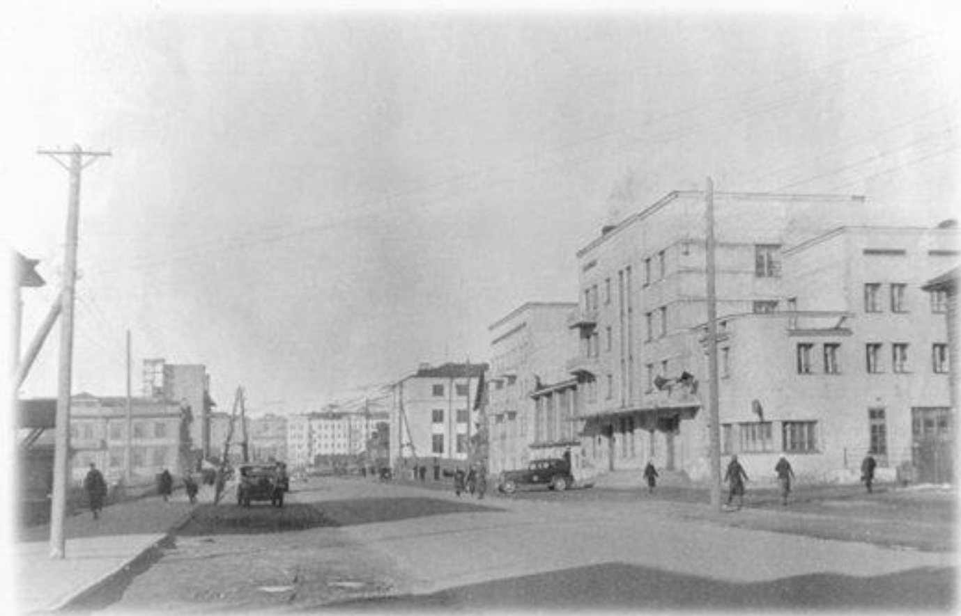
Улица Ленинградская, 1940 г.

С самых первых дней войны летом 1941 г. Мурманск, несмотря на свою значительную удаленность от западных рубежей СССР, где уже полным ходом велись боевые действия, сразу стал фронтовым населенным пунктом и портом.