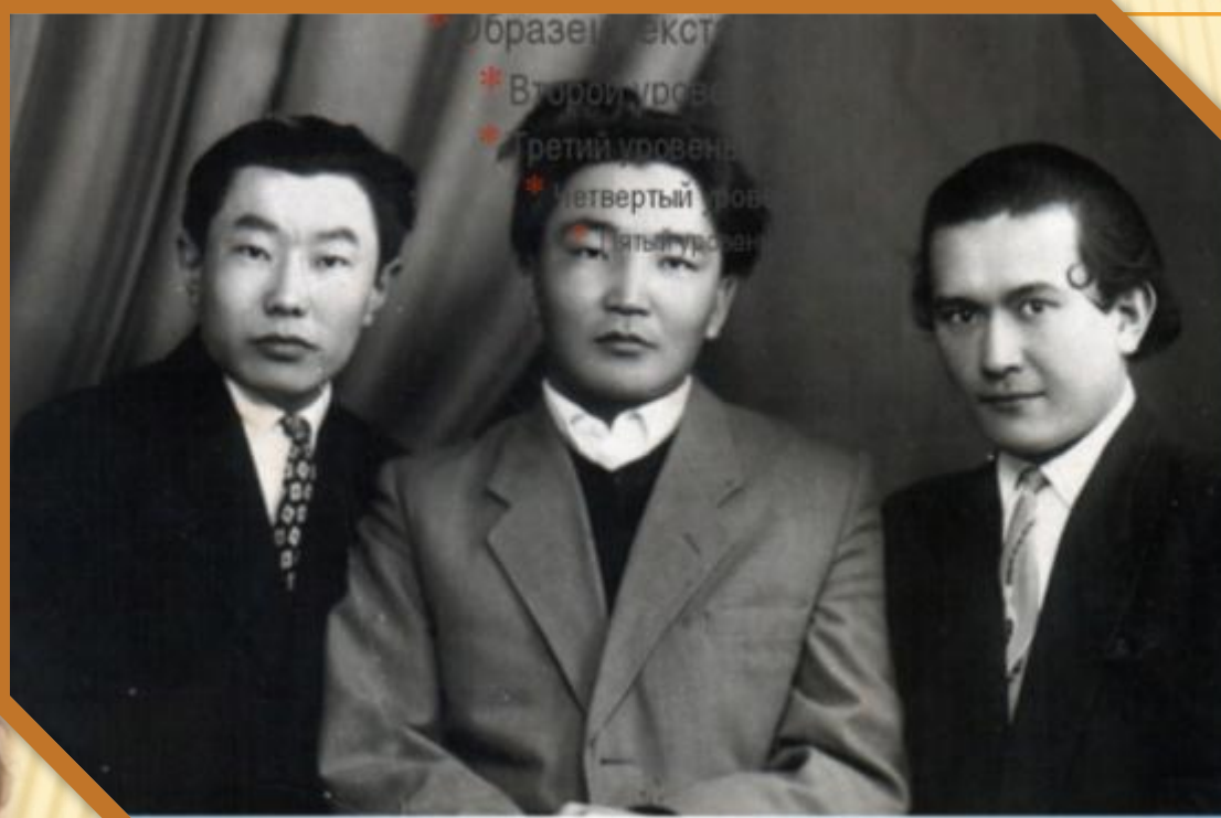
Кожо іренген нікірліри Аржан Адаров, Эркемен Палкин-базар ады–jarлу алтай бичиичилер.