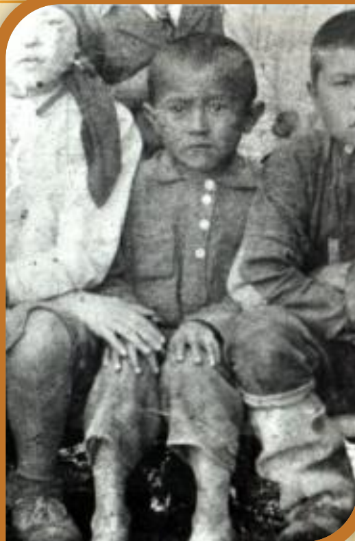
6 јашту Лазарь

Лазарьдыє јаш тужы јууныє кич ийлірине келишкен. Ол нікірліриле кожо момон, іркі тудуп, маєырлап јірер болгон.