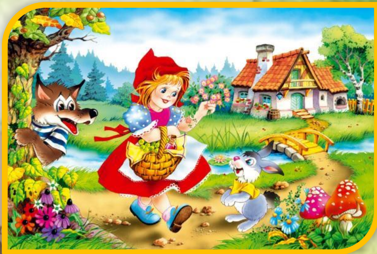
«Красная Шапочка»-Шарль Перро