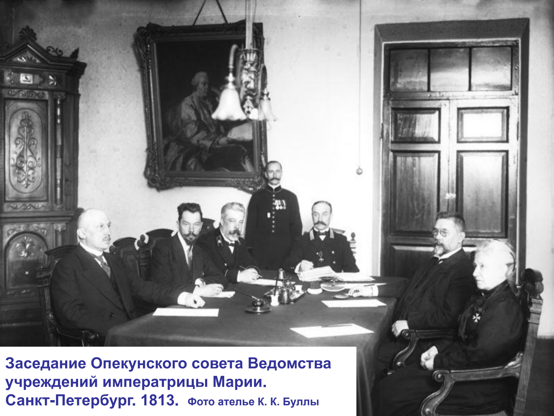
Заседание Опекунского совета Ведомства учреждений императрицы Марии. Санкт-Петербург. 1813.