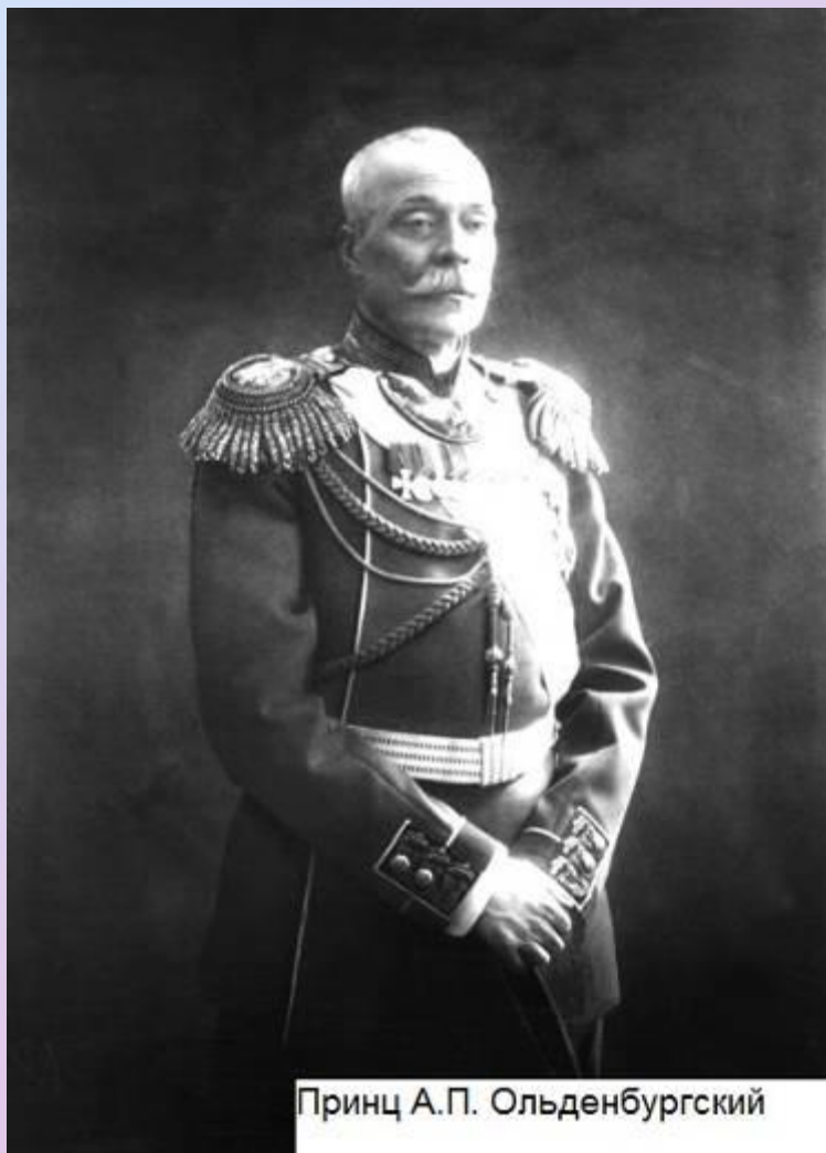
Принц А.П. Ольденбургский

Мужчины семьи Ольденбургских основывали больницы, институты, училища, их жены и сестры — общины сестер милосердия, женские учебные заведения, опекали учреждения искусства. Все их начинания отличали новаторство. На реализацию проектов они тратили большие средства.