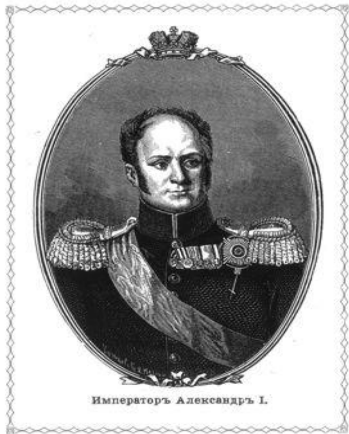
Императоръ Александръ I.

О быкновенное подаваніе нищимъ, умножая только число оныхъ, не упокоитъ старца, отягощеннаго лѣтами, не возвратитъ здоровья юношѣ, увядающему на зарѣ дней своихъ, не избавитъ отъ смерти или порока младенца, долженствующаго быть опорой отечества. Не рѣдко также наглый тунеядецъ похищаетъ отъ руки благотѣльной то, что назначено было отцу семейства, томящемуся на одрѣ смерти и отчаянія. Изъ сего слѣдуетъ, что растроганнымъ быть наружнымъ и весьма часто обманчивымъ видомъ нищеты и убожества, не есть еще благодѣяніе. Надлежитъ искать несчастныхъ въ самомъ жилищѣ ихъ—въ сей обители плача и страданія. Ласковымъ обращеніемъ, спасительными совѣтами, словомъ всѣми нравственными и физическими способами стараться облегчить