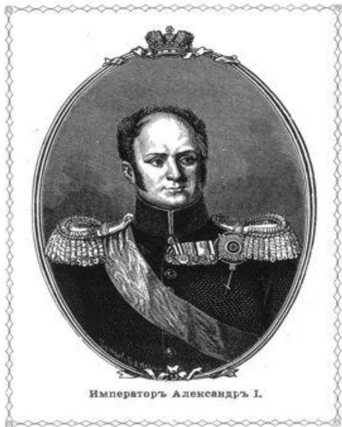
Императоръ Александръ I.

Обыкновенное подаваніе нищимъ, умножая только число оныхъ, не упокоитъ старца, отягощеннаго лѣтами, не возвратитъ здоровья юношѣ, увядающему на зарѣ дней своихъ, не избавитъ отъ смерти или порока младенца, долженствующаго быть опорой отечества. Не рѣдко также наглый тунеядецъ похищаетъ отъ руки благотѣльной то, что назначено было отцу семейства, томящемуся на одрѣ смерти и отчаянія. Изъ сего слѣдуетъ, что растроганнымъ быть наружнымъ и весьма часто обманчивымъ видомъ нищеты и убожества, не есть еще благодѣяніе. Надлежитъ искать несчастныхъ въ самомъ жилищѣ ихъ—въ сей обители плача и страданія. Ласковымъ обращеніемъ, спасительными совѣтами, словомъ всѣми нравственными и физическими способами стараться облегчить