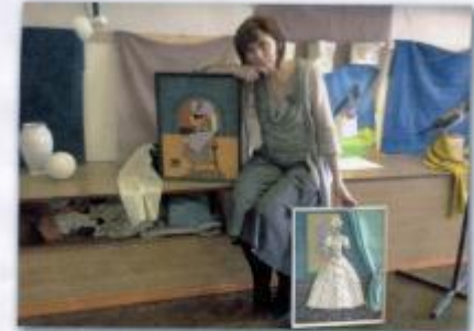
Творческие работы выпускников МБОУ ДОД "ДХШ им. И.С. Качинского" худ. проекта - "Создание театрального костюма".

это искать, изображать нечто такое, что не встречалось в прошлом опыте, индивидуальном и общественном. С.И.Ожегов