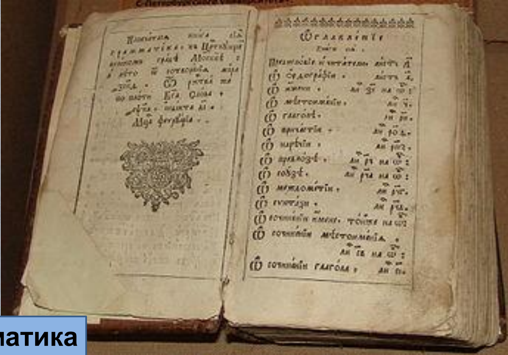
Грамматика Мелетия Смотрицког о