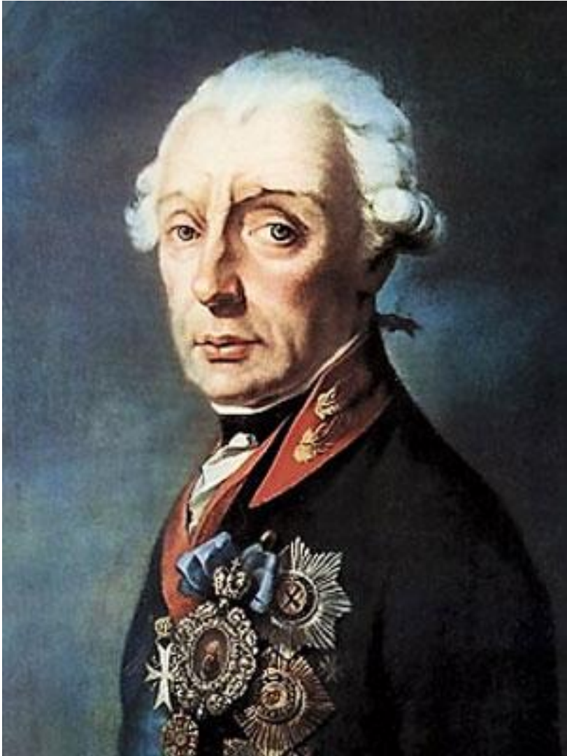
Александр Васильевич Суворов