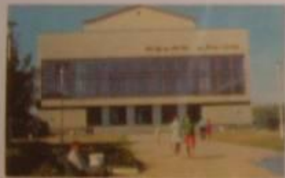
ДРАМАТИЧЕСКИЙ ТЕАТР ИМЕНИ А.С. ПУШКИНА