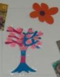
«Мы – разные»