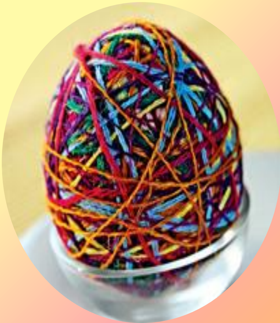
Яйцо из НИТОК