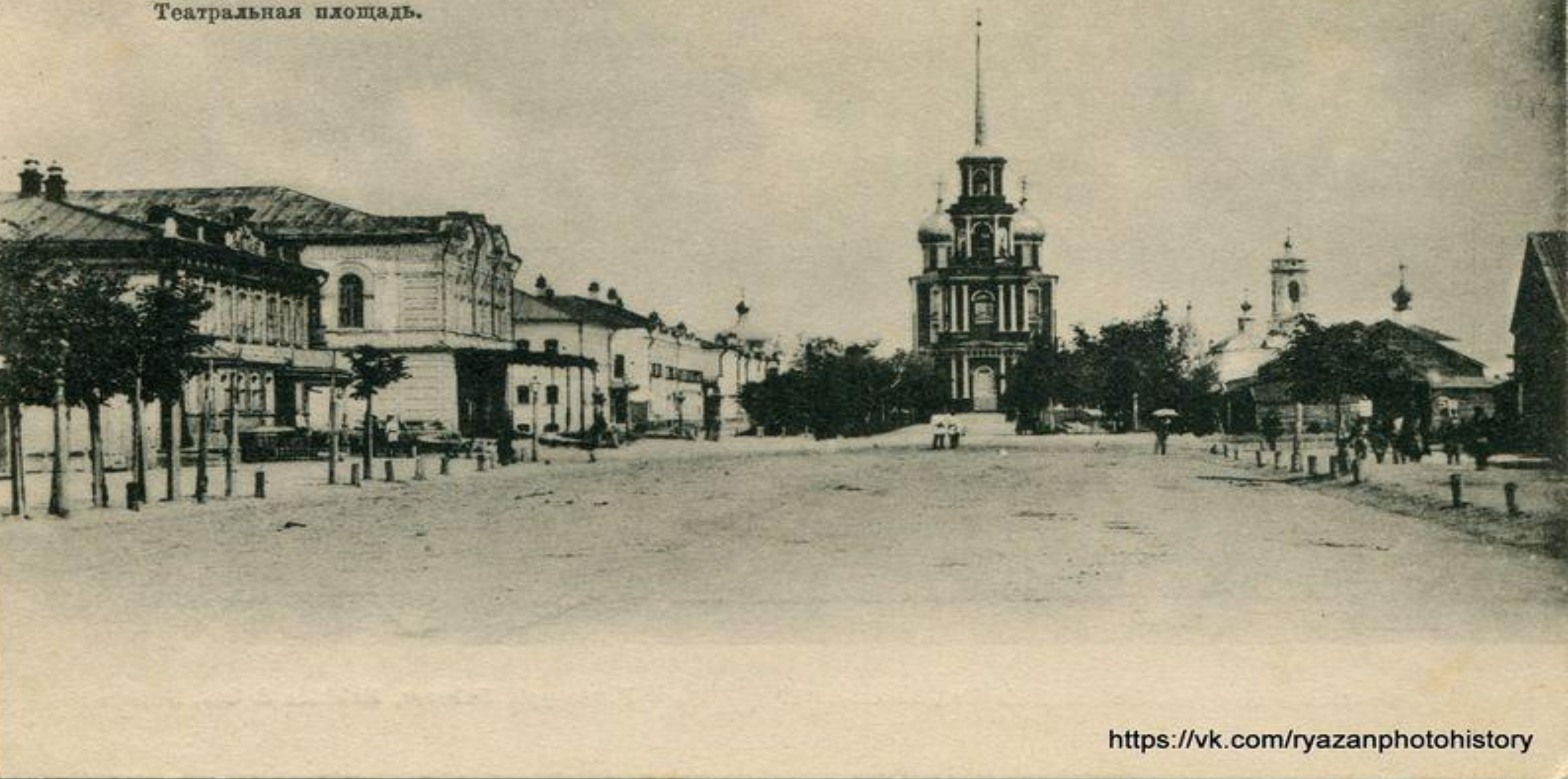
Рязань.—Riasan. № 1. Театральная площадь.