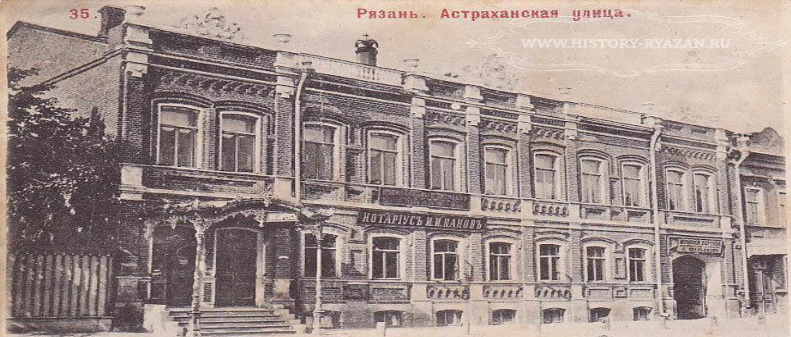
Издание С. С. Шемасса. Рязань.